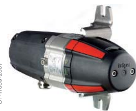
Dräger PIR 7000 Infrarot-Gastransmitter für die zuverlässige Detektion von brennbaren Gasen und Dämpfen.

Nach fast zwei Jahrzehnten Erfahrung mit Infrarot-Technologie – die zu einer kontinuierlich verbesserten Produktqualität geführt haben – wurde der Dräger PIR 7000 nach den Richtlinien der SIL-Standards EN 61508 und EN 50402 entwickelt und gefertigt.