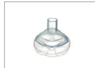
Maske, LiteStar®, Größe 1, Neugeborene