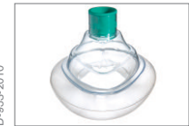
Maske, LiteStar®, Größe 6, Groß Erwachsene