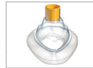
Maske, LiteStar®, Größe 5, Mittel Erwachsene