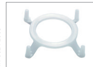
Hakenring für LiteStar® Masken mit 22 mm ID (Größe 3-6) Konnektor