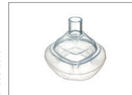
Maske, LiteStar®, Größe 2, Säuglinge