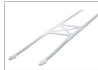
Kopfband, Silikon, wiederverwendbar, Groß