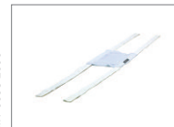
Kopfband, weicher Stoff, Einweg, Klein