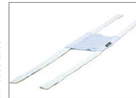
Kopfband, weicher Stoff, Einweg, Groß