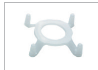
Hakenring für LiteStar® Masken mit 15 mm OD (Größe 1-2) Konnektor