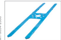
Kopfband, weiches Gummi, Einweg, Groß