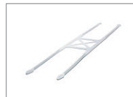
Kopfband, Silikon, wiederverwendbar, Klein