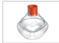
Maske, LiteStar®, Größe 4, Klein Erwachsene