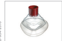
Maske, LiteStar®, Größe 3, Kleinkind