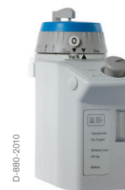
Dräger Vapor 2000 - Sevoflurane